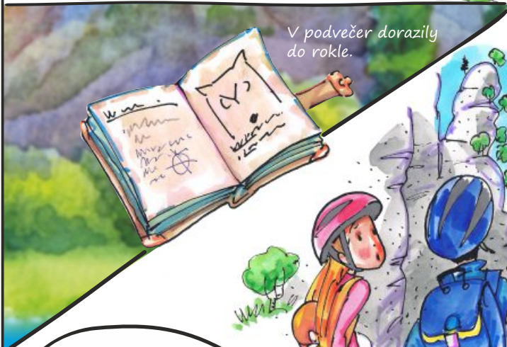
V podvečer dorazily do rokle.

Celou dobu přemítaly, co asi znamenají profesorovy poznámky. Vše nasvědčovalo, že jde o šifru.