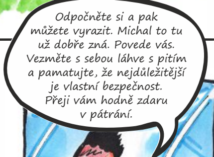
O chvíli později ve stanu vedoucího