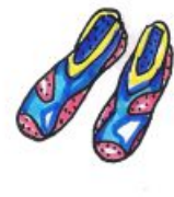
boty do vody